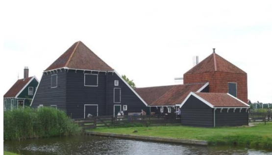
Doorlopende witte lijnen, samenhangend ensemble