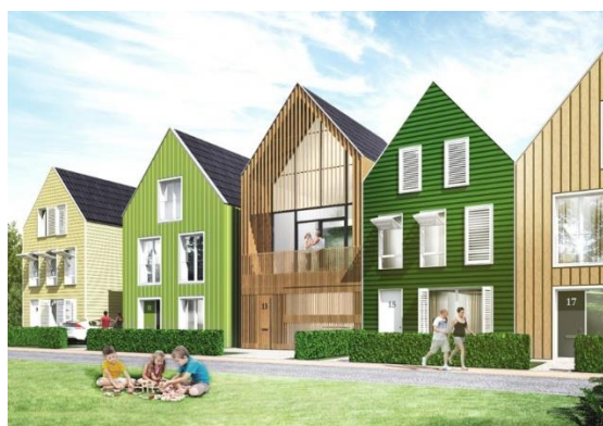
Afwisseling in kleur, materiaal;