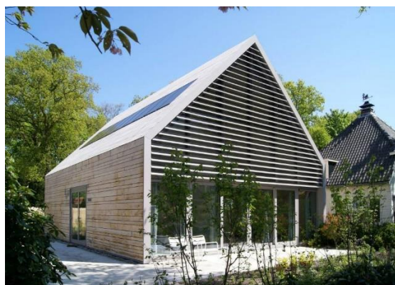
Moderne vertaling schuurtypologie