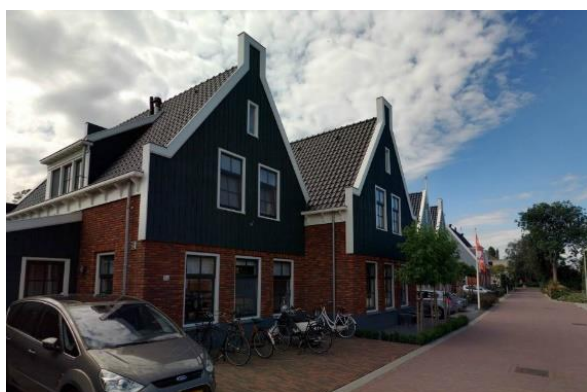
Afwisseling in rooilijn