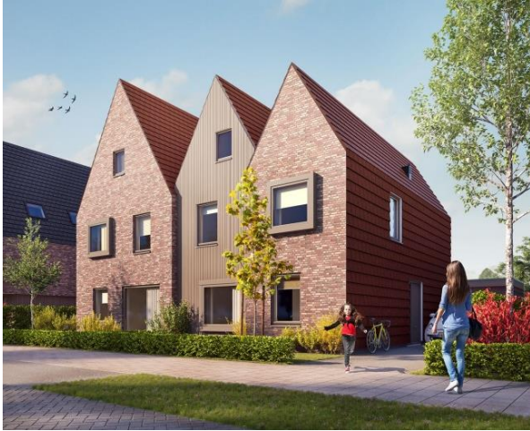
Kap om volume heen getrokken