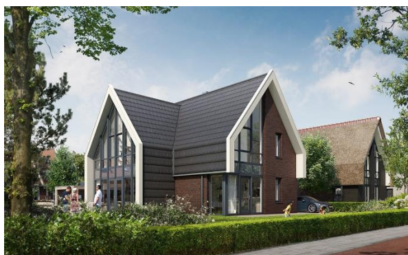
Dubbele oriëntatie, witte lijsten