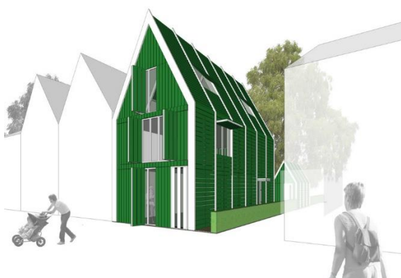
Moderne vertaling Zaaans huis